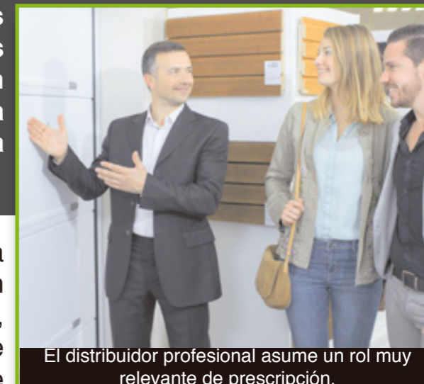
El distribuidor profesional asume un rol muy relevante de prescripción.

Los sistemas cerámicos son soluciones constructivas con revestimiento de baldosas cerámicas por adherencia que se pueden clasificar atendiendo a diversos criterios. La norma de colocación ya vigente opta por una clasificación en función de su ubicación.